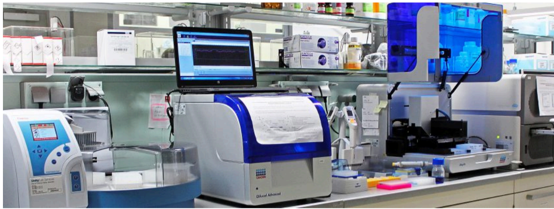
Kostenintensiv: Biotechnologie-Labor für innovative Pflanzenzüchtung.